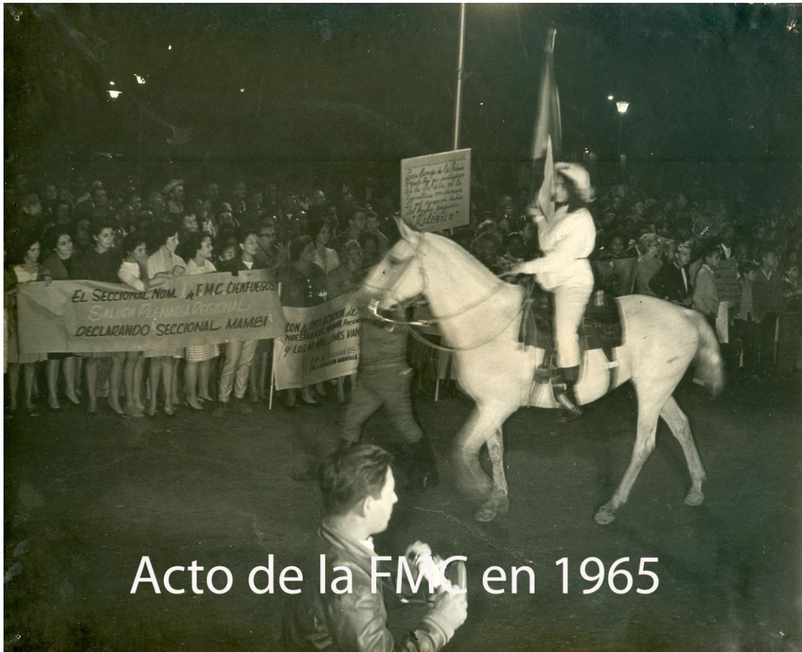
Acto de la FMC en 1965