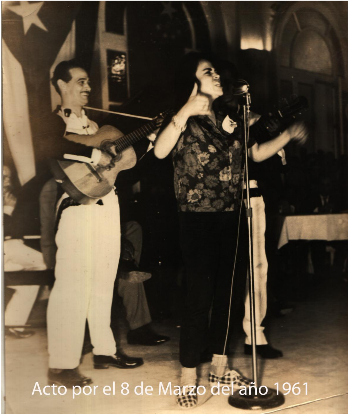
Acto por el 8 de Marzo del año 1961