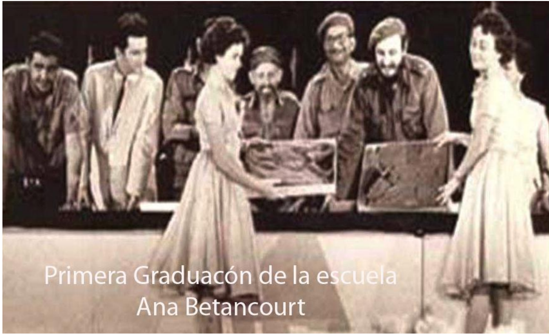
Primera Graduación de la escuela Ana Betancourt