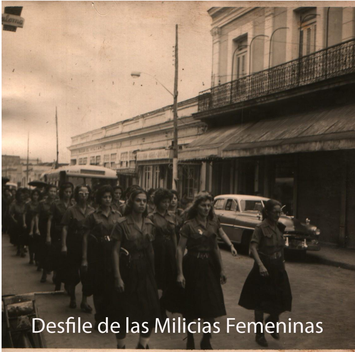
Desfile de las Milicias Femeninas