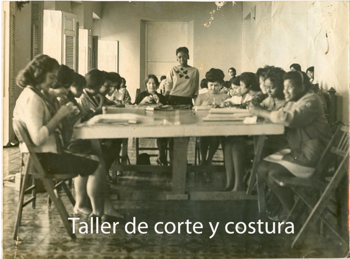
Taller de corte y costura