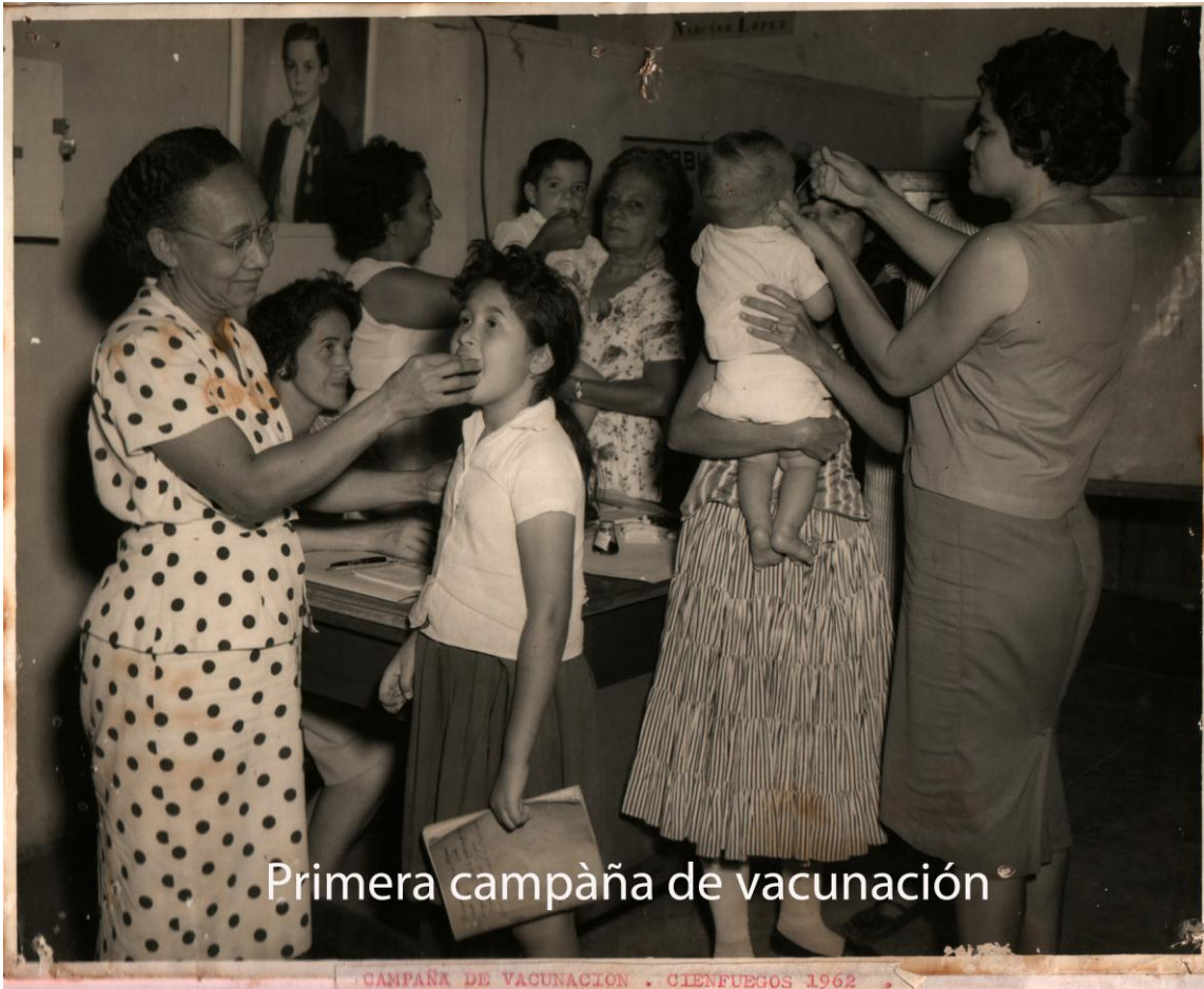
Primera campaña de vacunación