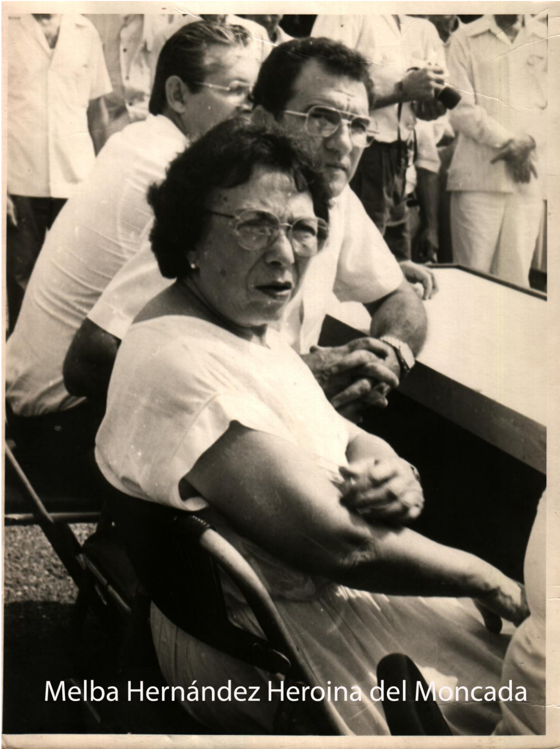
Melba Hernández Heroína del Moncada