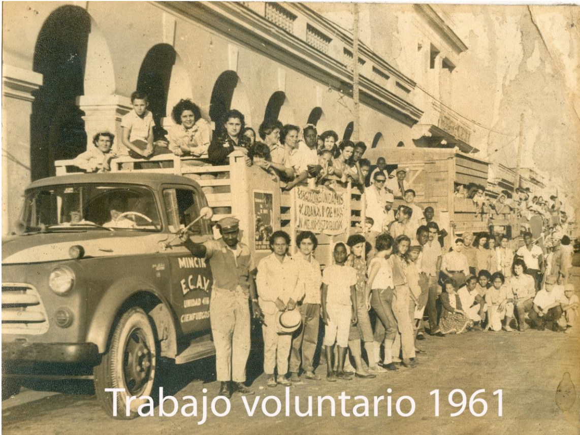
Trabajo voluntario 1961