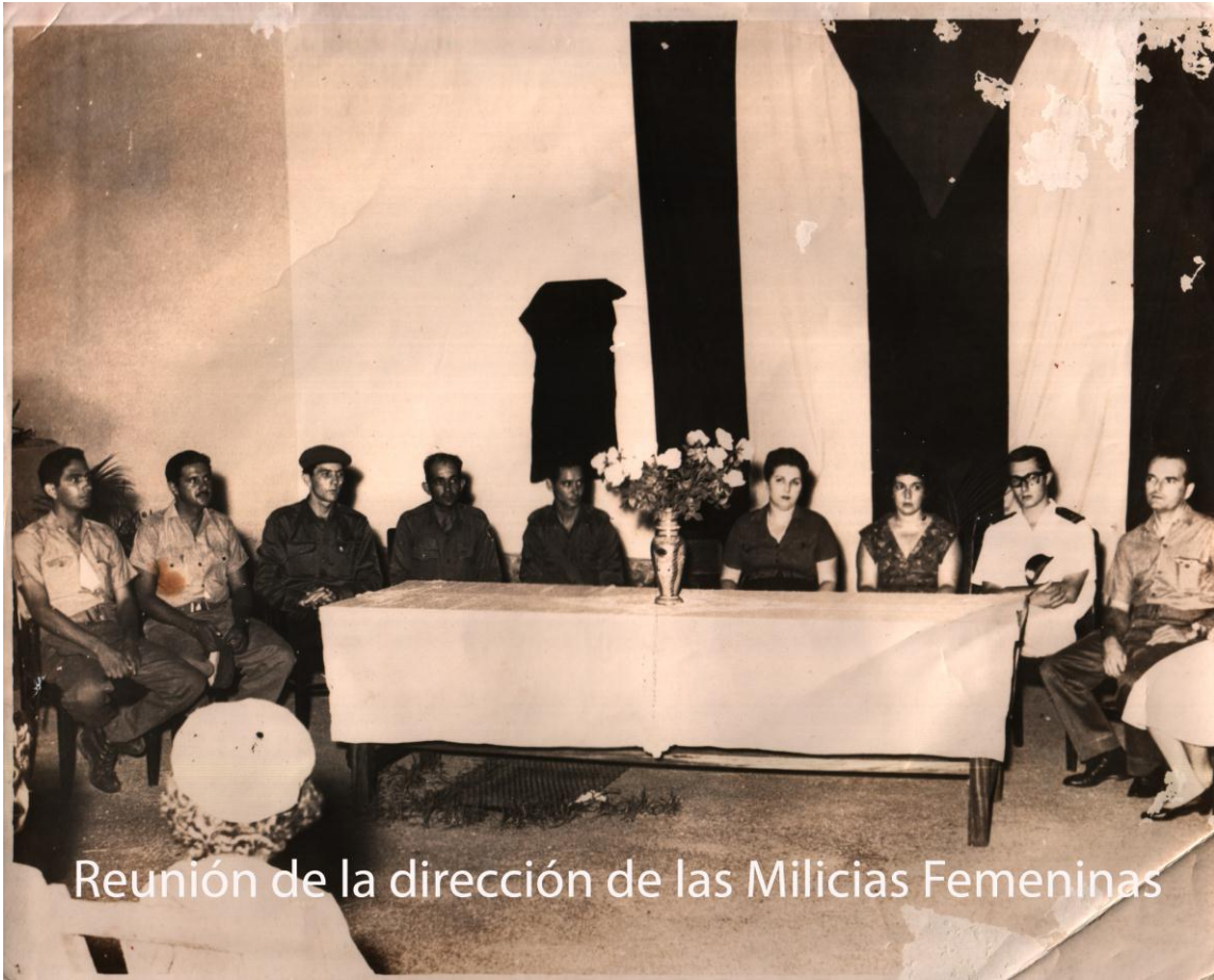
Reunión de la dirección de las Milicias Femeninas