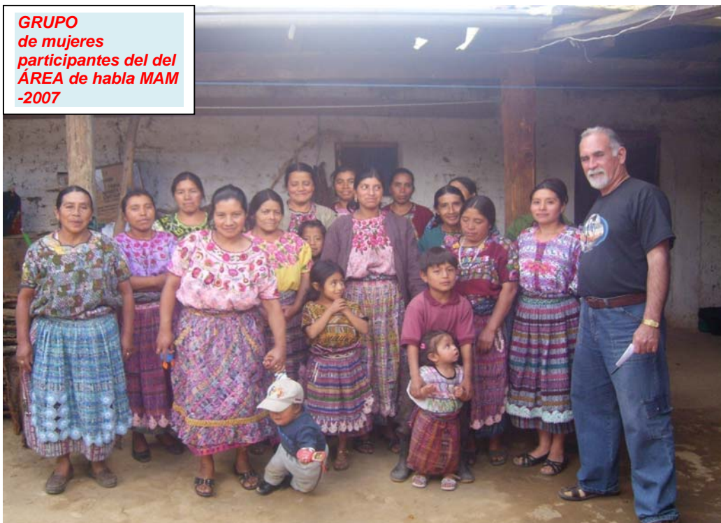
GRUPO de mujeres participantes del del ÁREA de habla MAM -2007