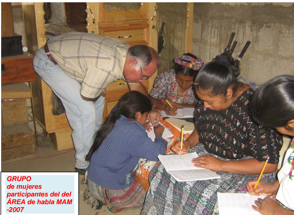
GRUPO de mujeres participantes del del ÁREA de habla MAM -2007